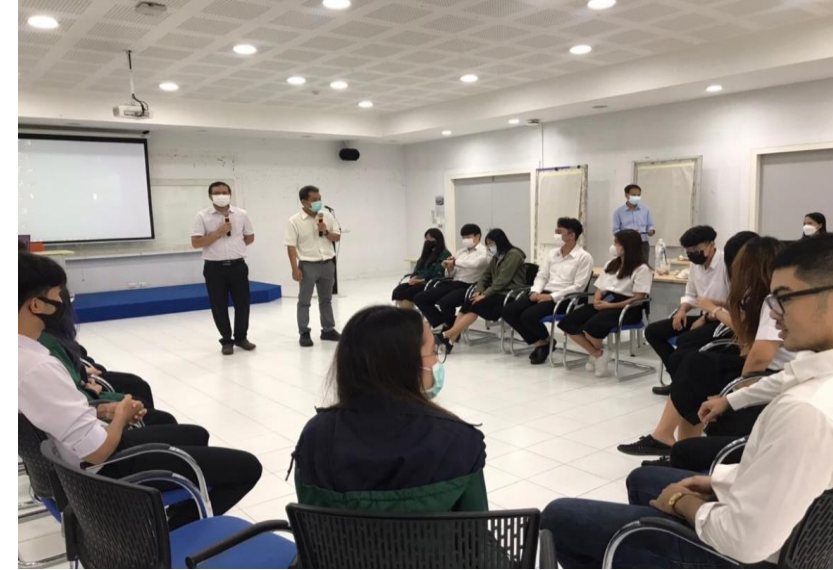
กิจกรรม "นักศึกษาแพทย์รุ่นใหม่ สดใส ใจดี มีมิติ"

พัฒนาศักยภาพนักศึกษาทางด้าน hard และ soft skills