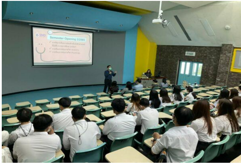
กิจกรรม Semester Opening