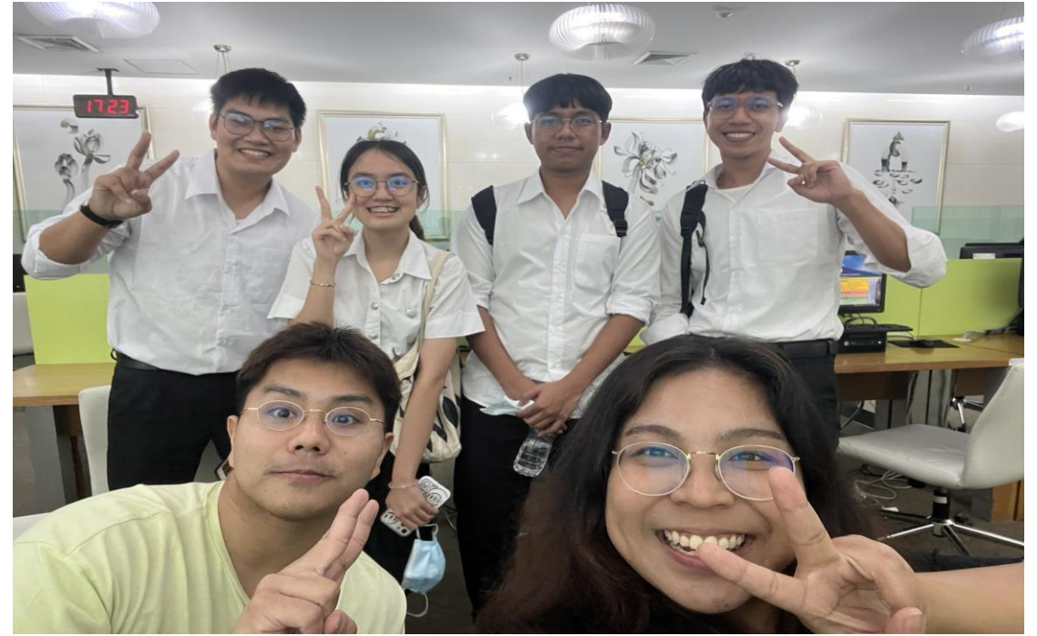
The Second Round: 12th SIMPIC (Siriraj International Medical Microbiology, Parasitology, and Immunology Competition)

พัฒนาศักยภาพนักศึกษาทางด้าน hard และ soft skills