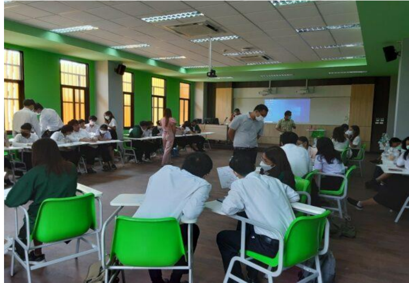
กิจกรรม “เติมพลังใจ สร้างพลังบวก (Power Up My Life)”